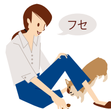
「フセ」と言って、ゆっくり子イヌの鼻先から前の方にフードを子イヌから離していきます