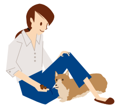
そうすると、脚の下をくぐり「フセ」が出来ました