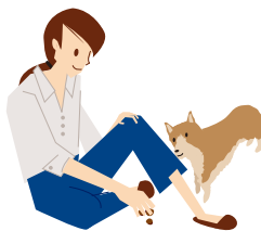
フードなどを持って 子イヌの関心を高める