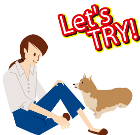
片脚を立ててトンネルを作り

「フセ」と言ってフードをイヌの鼻先から前足の間まで下ろします。イヌがフセの体勢になったら「いい子だね!」と言ってフードをあげます。オスワリの体勢からフセをさせるほうが簡単にできます。なかなかフセの体勢にならずにお尻があがってしまう場合は、床に座って脚を立ててトンネルを作り、イヌをその中に通すようにするとフセの体勢に誘導することができます。そして、手にフードを持っていなくても、手を下に下ろすハンドシグナルでフセができるように練習し、最終的には号令だけでフセができるようにしましょう。